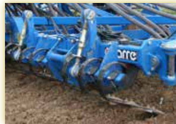
FB ou FH